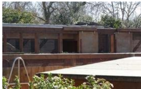
Figuras 5 y 6.