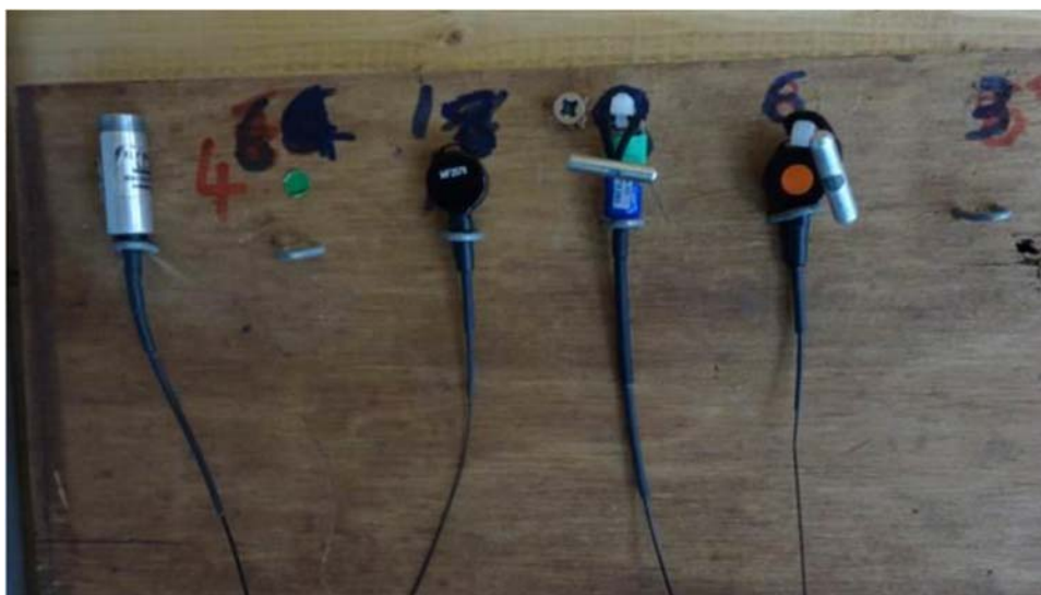
Figura 15. Diferentes transmisores, los más pequeños en este caso se fijan al ojal de las tobilleras del ave.

Para especies más pequeñas como cernícalos ( Falco tinnunculus ), esmerejones ( Falco columbarius ), lechuzas campanario ( Tyto alba ), o especies de tamaño similar, se deben utilizar transmisores más livianos. Es importante considerar un equilibrio entre seleccionar un transmisor liviano con su capacidad para proveer un rango significativo que permita el rastreo de incluso las especies que pueden volar largas distancias y aumentar sorprendentemente la altura en muy poco tiempo.