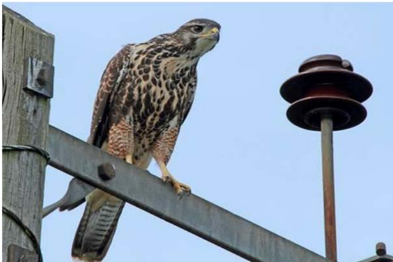
Figura 19. Híbrido entre un busardo mixto que escapó y un gavián silvestre en Reino Unido.

En los peores casos, han habido situaciones en las que las aves que escapan se han hibridado con otras especies (por ejemplo, un busardo mixto de cetrería se escapó y se apareó con un gavián silvestre, el polluelo ahora reside en la reserva de Amwell RSPB en el Reino Unido, y fue apropiadamente llamado como "Hazzard" ("Azar" en inglés) (Figura 19).