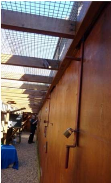
Figura 7. Sistemas de bloqueo y apertura de puertas correderas

En base al sistema mostrado en las figuras 5 y 6, el énfasis en la seguridad recae en el personal de demostraciones y en los protocolos específicos que se deben implementar y seguir. Cuando se libera un ave, el acceso debe cerrarse de manera inmediata para evitar que re-ingrese si es que el ave se devuelve por otra ruta. (Muchas aves pueden volar pasando por las puertas de su recinto hacia un guante o un área temporal de espera hasta que finalice la demostración). Si el ave se devuelve a su recinto, el acceso de ingreso/salida debe ser cerrado inmediatamente. La ubicación del acceso y la visibilidad del ave al momento de volar ya sea hacia o desde una persona del equipo de demostraciones son fundamentales para que el programa sea exitoso. Deben existir seguros o sistemas de bloqueo sencillos de operar en las puertas de acceso (Fig. 7).