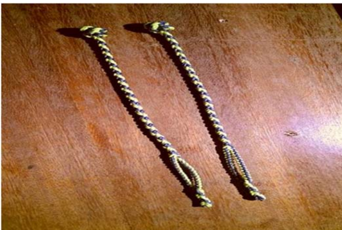
Figura 8. Pihuelas trenzadas para cambio de plumaje