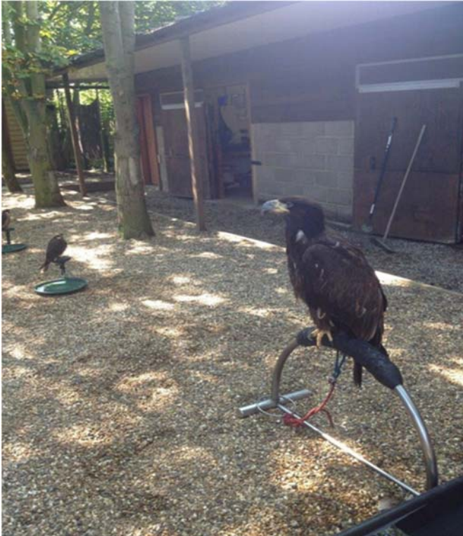
Figura 11. Se observa una percha en arco cubierta con goma. Nótese el anillo grande que se desliza por sobre la parte superior de la percha.