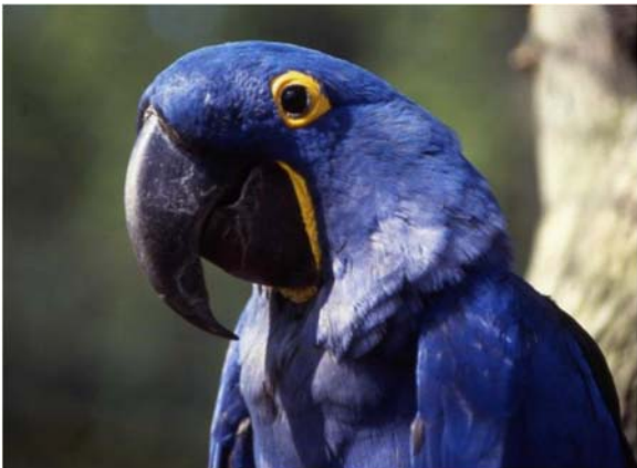
Figura 20. El guacamayo jacinto alcanza su madurez sexual a los 5 o 6 años de edad.

Algunas especies como el guacamayo jacinto ( Anodorhynchus hyacinthinus ) (Figura 20), se demoran un par de años antes de alcanzar la madurez sexual. Puede ser beneficioso para el ave y para generar un mensaje educativo, que ella participe dentro de actividades educativas en vivo si es que puede incluirse en vuelos libres y ejercitarse antes de ingresar a un programa de reproducción. Para esta especie, sus necesidades sociales deben recibir las mismas consideraciones que para las otras especies. Si es que las aves vuelan juntas, el vuelo libre facilitará establecer un vínculo entre parejas antes de la reproducción.