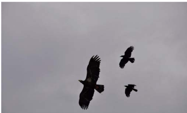
Figura 9. Un águila calva juvenil es acosada por cuervos durante un vuelo.