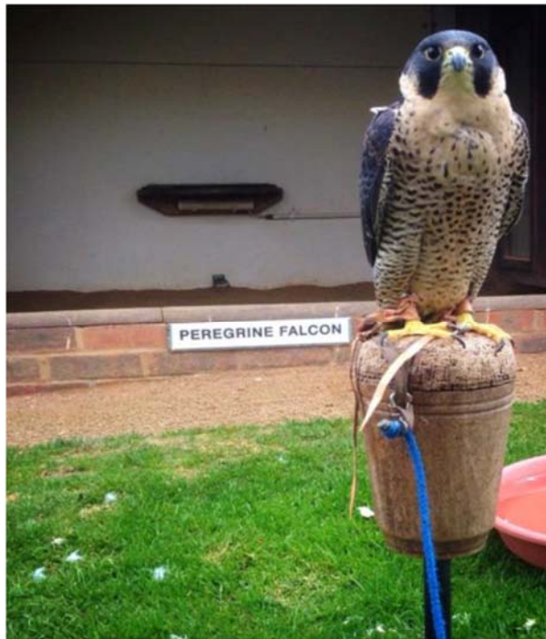
Figura 10. Halcón peregrino sobre una percha “banco” de características apropiadas.